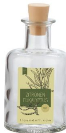
Zitroneneukalyptus Bio (Naturreines Zitroneneukalyptusöl)