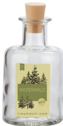
Winterwald (Orange mit Gewürzen)