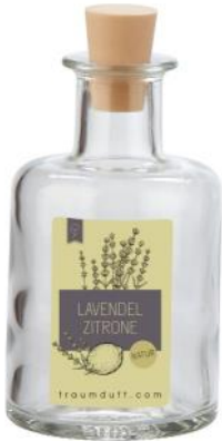
Lavendel Zitrone (Lavendel und Zitronenöl)

Geliefert in der 180 ml Apotheker Klarglasflasche inkl. 8 Duftstäbchen