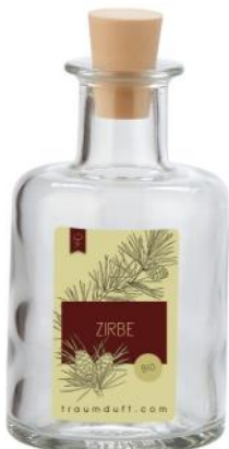
Zirbe (Naturreines Zirbenöl)