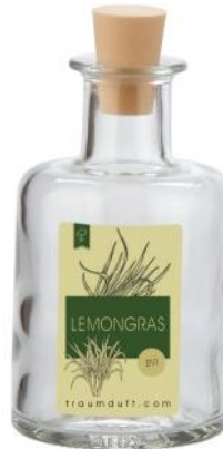
Lemongras Bio (Naturreines Lemongrasöl)