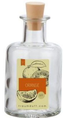
Orange Bio (Naturreines Orangenöl)