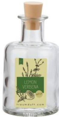
Lemon Verbena (Belebende Duftkreation)