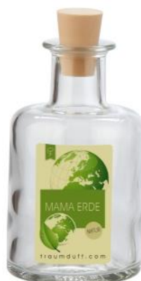
Mama Erde (Blüten- und wohltuende holzigen Noten)