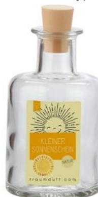
Kleiner Sonnenschein (Orange, Beeren und Würze)