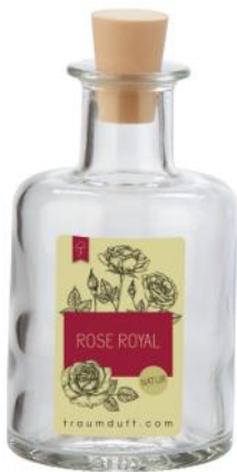
Rose royal (feine Rosennote)